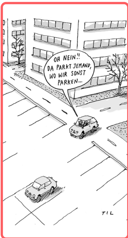
In den Bildern: Til Mette Cartoons zu aktuellen Themen